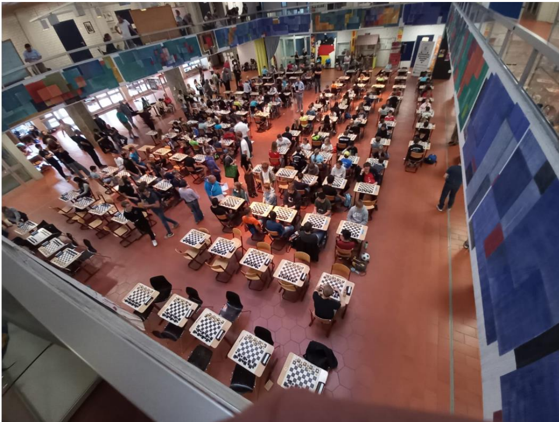
Blick in den schönen Turniersaal in Bamberg.

Insgesamt also ein sehr gelungener Ausflug unserer beiden Jugendlichen nach Bamberg!